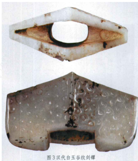
图3 汉代白玉谷纹剑鐔