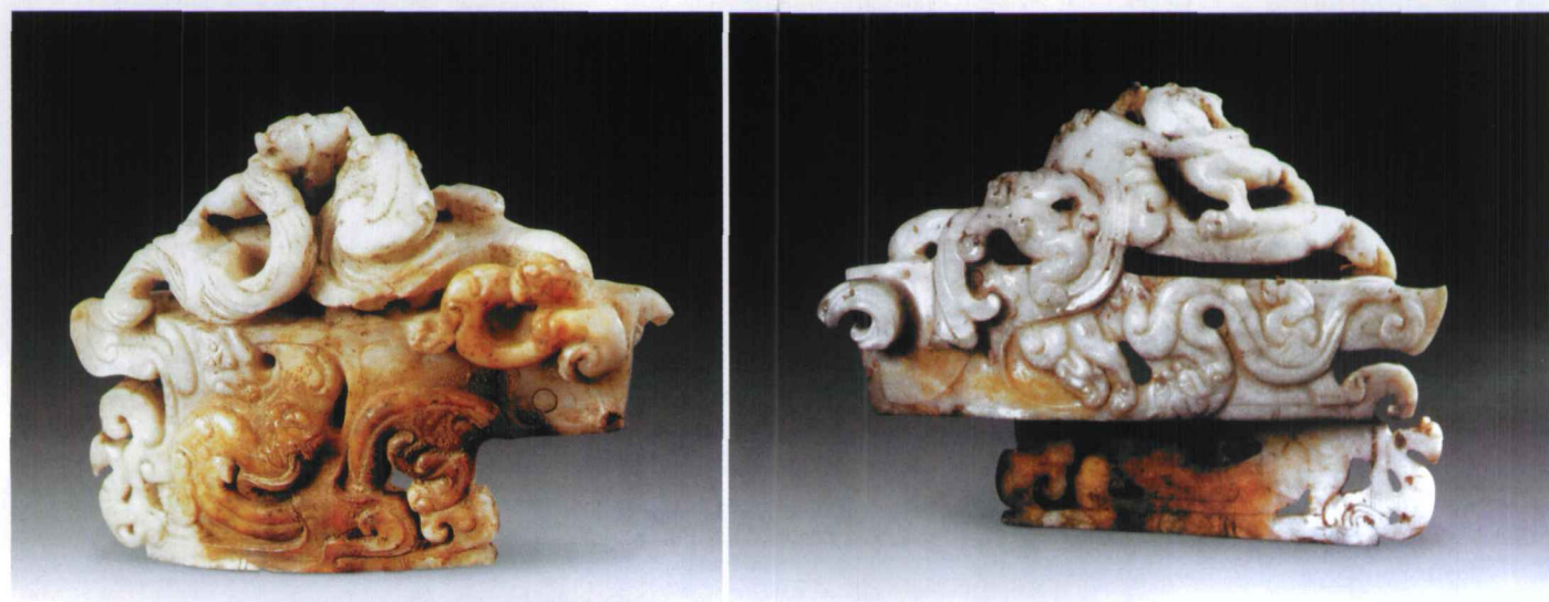
图2 汉代白玉镂空螭纹剑首