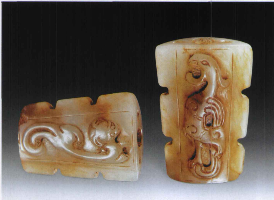
图8 清代白玉仔料螭龙鸟纹剑首