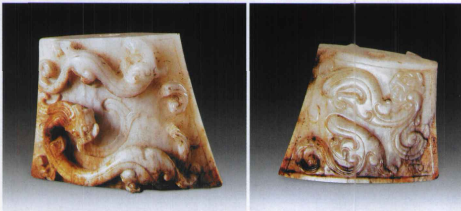
图7 汉代白玉螭纹珪