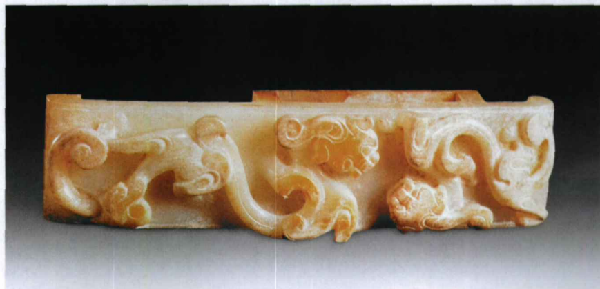
图5 汉代青白玉子母螭龙纹璠