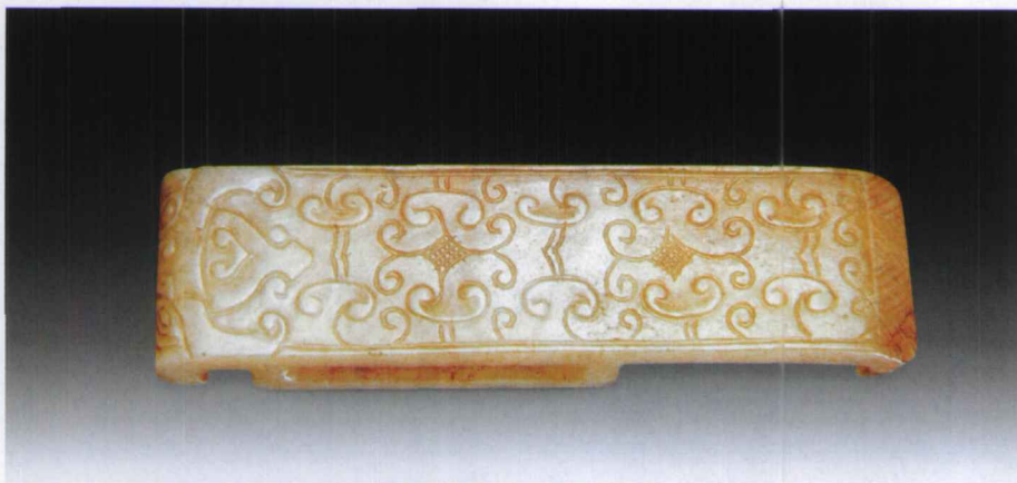
图6 汉代青白玉兽面云纹珪