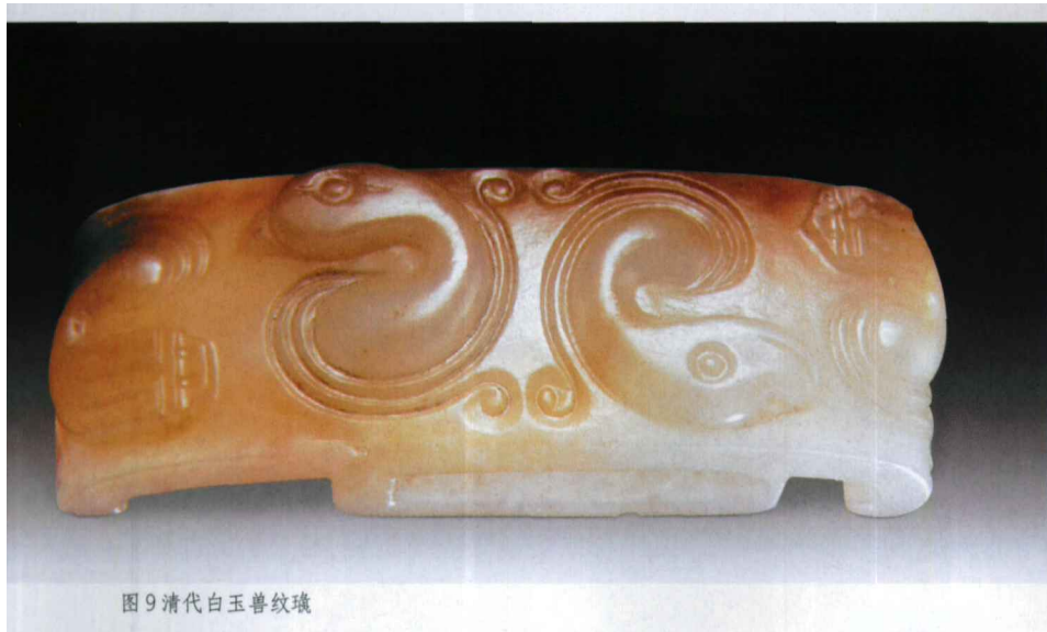
图9 清代白玉兽纹璜

兽面。兽面略方，大眼，上眼眶近平，眼梢伸出脸廓卷曲，眉毛方折近矩形，蒜头鼻，额头两侧、眉心、脸颊各有一阴起乳突，咬牙咧嘴露出牙齿，面目狰狞。兽面轮廓周围铲地碾平，压地雕琢的鼻子边缘以阴线勾勒轮廓，眼眶、嘴唇以偏刀斜