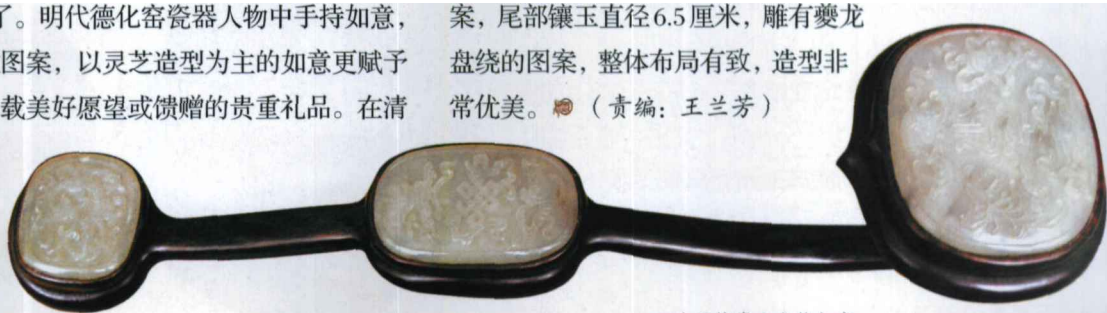
白玉镶嵌八宝纹如意

如意大都是用珍贵材料制作，象牙、玉石、翡翠、珊瑚、玛瑙、紫檀木等等。一般为30~40厘米左右，一边是翘起的如意头，中间是柄。有用整块材料雕琢成的，也有镶嵌金银宝石的，用料考究，精工细做。笔者现介绍一柄如意，此如意主体为红木制成，在头、尾和柄的中部各镶一块上等和田玉，玉质莹润。柄为“S”形，通长48厘米，头端镶椭圆形白玉，直径10厘米，中心有一高浮雕“寿”字及宝瓶、金鱼、宝伞和妙莲等图案。柄中部镶玉直径8.8厘米，中心雕有中国传统的如意结盘肠，上下分别有海螺、宝伞组成的图案，尾部镶玉直径6.5厘米，雕有夔龙盘绕的图案，整体布局有致，造型非常优美。●（责编：王兰芳）