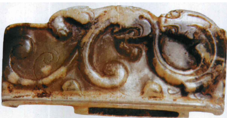
图4 汉代青白玉螭龙纹璠